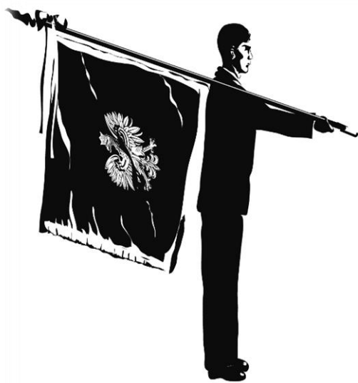
sztandar na ramieniu

Chorąży kładzie drzewce na prawe ramię i trzyma je prawą ręką pod kątem ok. 45°. Płat sztandaru musi być oddalony od barku przynajmniej na szerokość dłoni. Lewa ręka opuszczona wzdłuż tułowia.